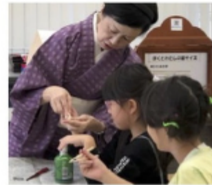
お箸の持ち方指導です