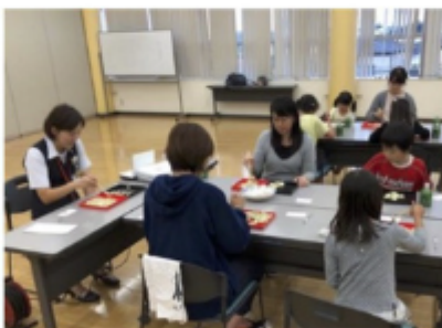
親子で箸ピーゲーム