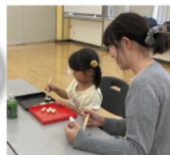
お箸の持ち方練習のあと