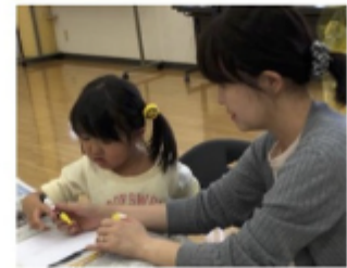
初めての箸絵付け どの子も真剣です！